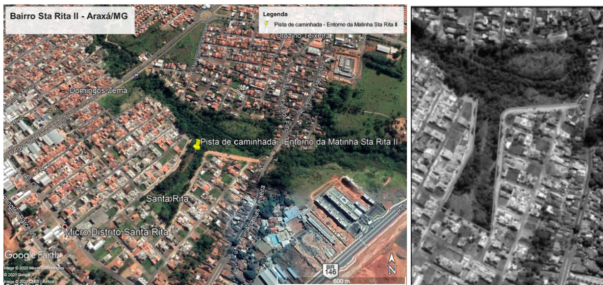
IMAGEM DE SATÉLITE - LOCALIZAÇÃO DA OBRA DE PINTURA DA PISTA DE CAMINHADA - SANTA RITA II RUA ANTÔNIO VIEIRA LOPES S/N - BAIRRO SANTA RITA II - ARAXÁ/MG

NOME DO PROJETO: PINTURA DA PISTA DE CAMINHADA - SANTA RITA II ENDEREÇO: RUA ANTÔNIO VIEIRA LOPES S/N - STA RITA II - ARAXÁ/MG TIPO: SINALIZAÇÃO DE TRANSITO DE PEDESTRES E DE VEÍCULOS